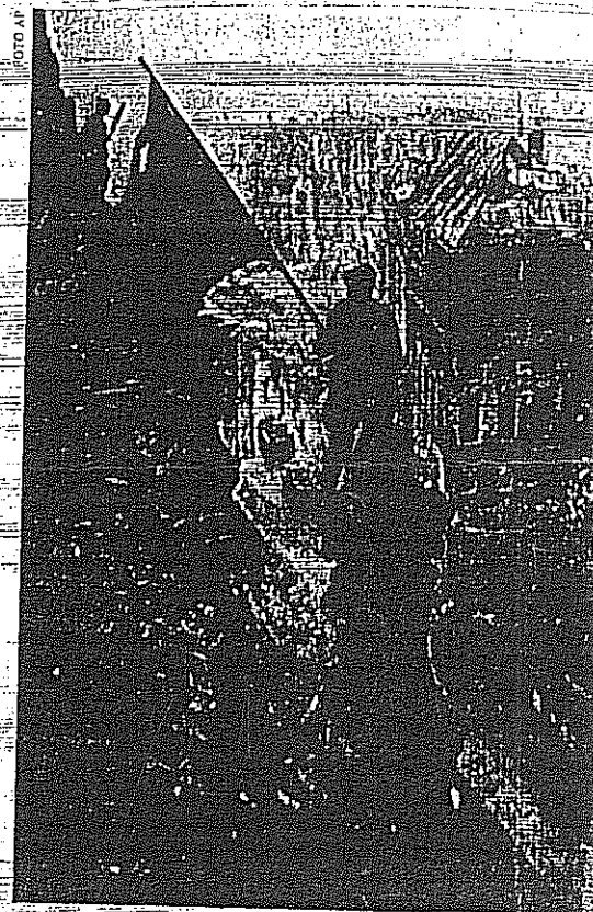
Říšský sněm jako symbol porážky nacistického Německa: rudá vlajka nad Reichstagem v roce 1945

Ani zrušení občanských a politických svobod neschválili němečtí poslanci v roce 1933 v budově Říšského sněmu: stalo se to v Krollově opeře v Berlíně. A za nacistické éry se v budově Reichstagu nic zásadnějšího nedělo. V průběhu války používala Říšský sněm armáda. A ještě dříve, než přišli Rusové, poškodily budovu bomby spojeneckých letadel.